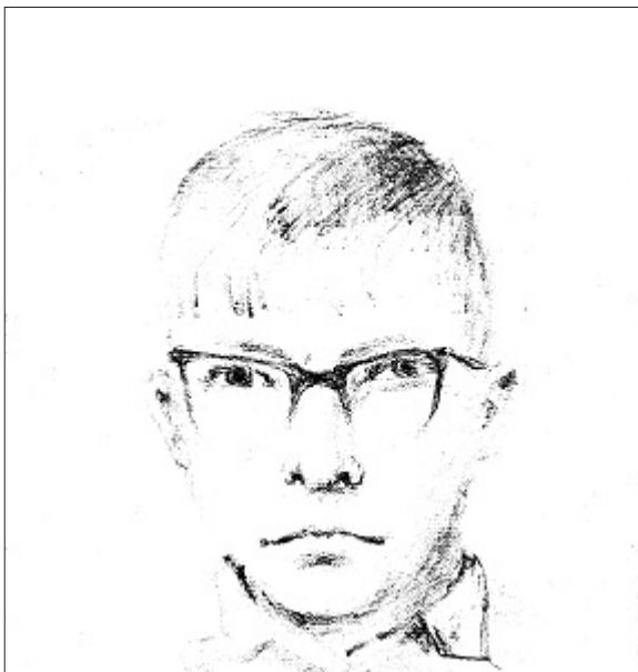
(Это мой карандашный портрет, сделанный соседкой-закройщицей, когда мне было 12-13 лет)